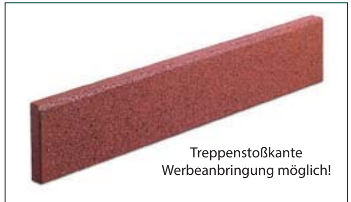
Treppenstoßkante Werbeanbringung möglich!