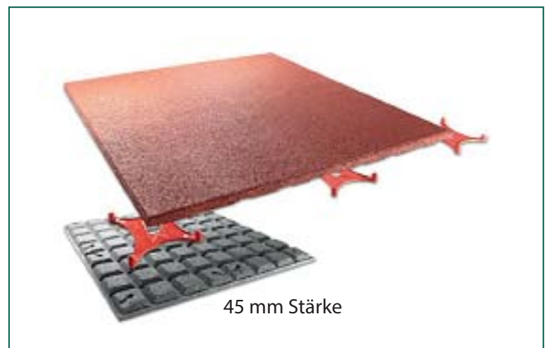
45 mm Stärke