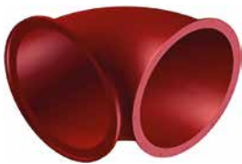
Bogen 90° eng Art.-Nr. 3915