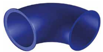
Bogen 90° weit Art.-Nr. 3914