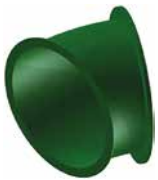
Bogen Eingang 30° Art.-Nr. 3911