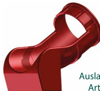
Auslauf zweiteilig Art.-Nr. 3920

Abweichungen der farblichen Wiedergabe in den Abbildungen sind drucktechnisch möglich. Es gelten die AGB der Tri-Poli oHG, einsehbar unter www.tri-poli.de , technische Änderungen vorbehalten.