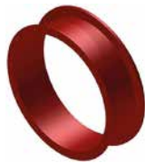
Gerade 25cm Art.-Nr. 3912