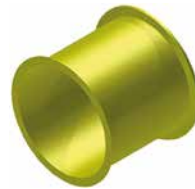
Gerade 75cm Art.-Nr. 3913