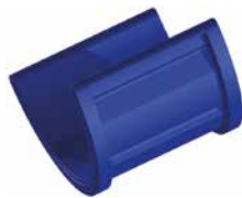
Verlängerung Auslauf Art.-Nr. 3919